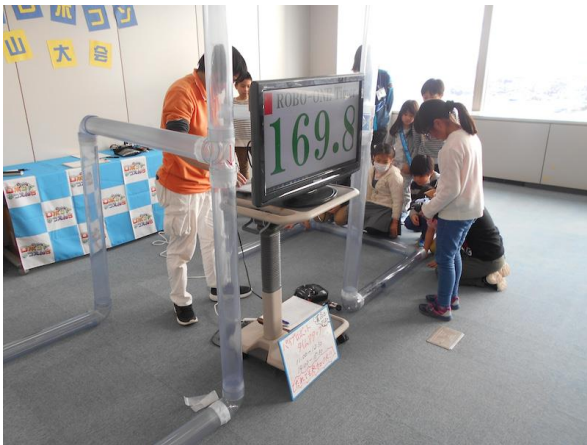
パイプロボコン/タイムアタックの様子