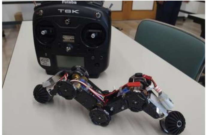
レンタル用/パイプロボット