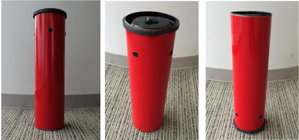
真横から(左) / 斜め上から(中) / 多脚クラス用に上下逆にした形 (右)

パイロンは直径約 10cm、高さ 30cm の円筒形で、KYOSHO 製「D フレックス カラーデカール レッド 96721R」を円筒の側面全周に貼り付けている。円筒の上下面は黒色の塗装が施され、縁に暗灰色保護材が貼り付けられている場合がある。円筒の側方から見た場合に、円筒の上下面とその保護材の幅は 1cm を超えない。円筒上面には超音波送信機のスイッチが設置され、競技中は動作確認用の LED ランプが点灯している。パイロンを立てたとき、床面から高さ 25cm の側面に超音波送信機(KONDO 製 USTX-1 出力強化仕様、到達距離 5m 以上)が 90° ごとに 4 つ埋め込まれている。